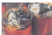
Vă împărtășesc secretul furat de...