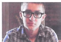
Acest student vă va spune cum să...