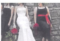
Ne-am căsătorit doar după ce am...