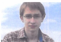
Mulțumită acestui student, toți...