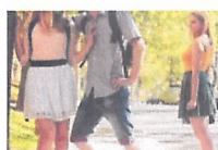
I-am suflat iubitul rivalei după ce...