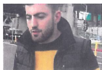
Angajat al aeroportului...