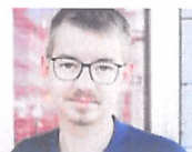
Băncile îl urăsc pe acest student...